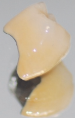
Krone: NEM vollverbl.